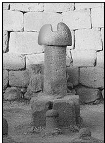
Каменный фаллос в древнем языческом храме

Стоит подробнее остановиться именно на истории этого древнего культа, связанного с фаллической