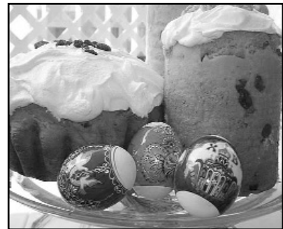
Белая глазурь на куличе - символ эрекции фаллоса