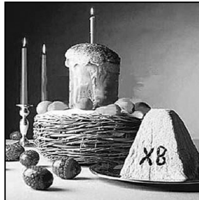
Пасхальный кулич имеет ту же фаллическую форму