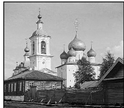
Форма зданий и купола, так же имеют форму возбужденного фаллоса