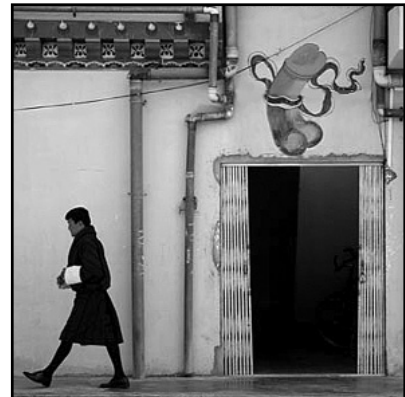
В современном Бутане до сих пор фаллос изображается над дверями зданий